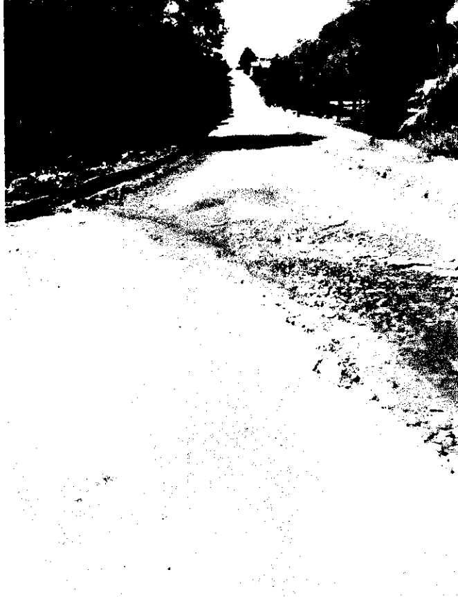
Figura 1 - Situação atual da rua Antônio Batista.