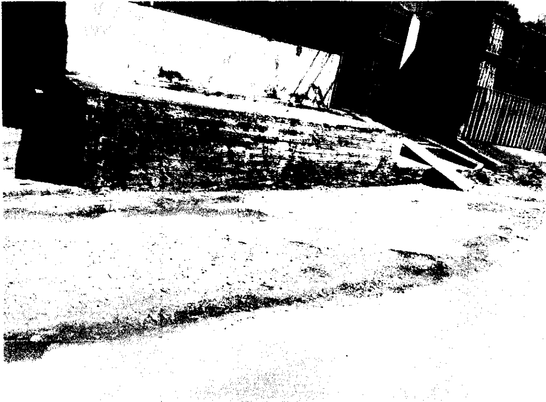
Figura 4 - Situação atual da rua Newton Bello.