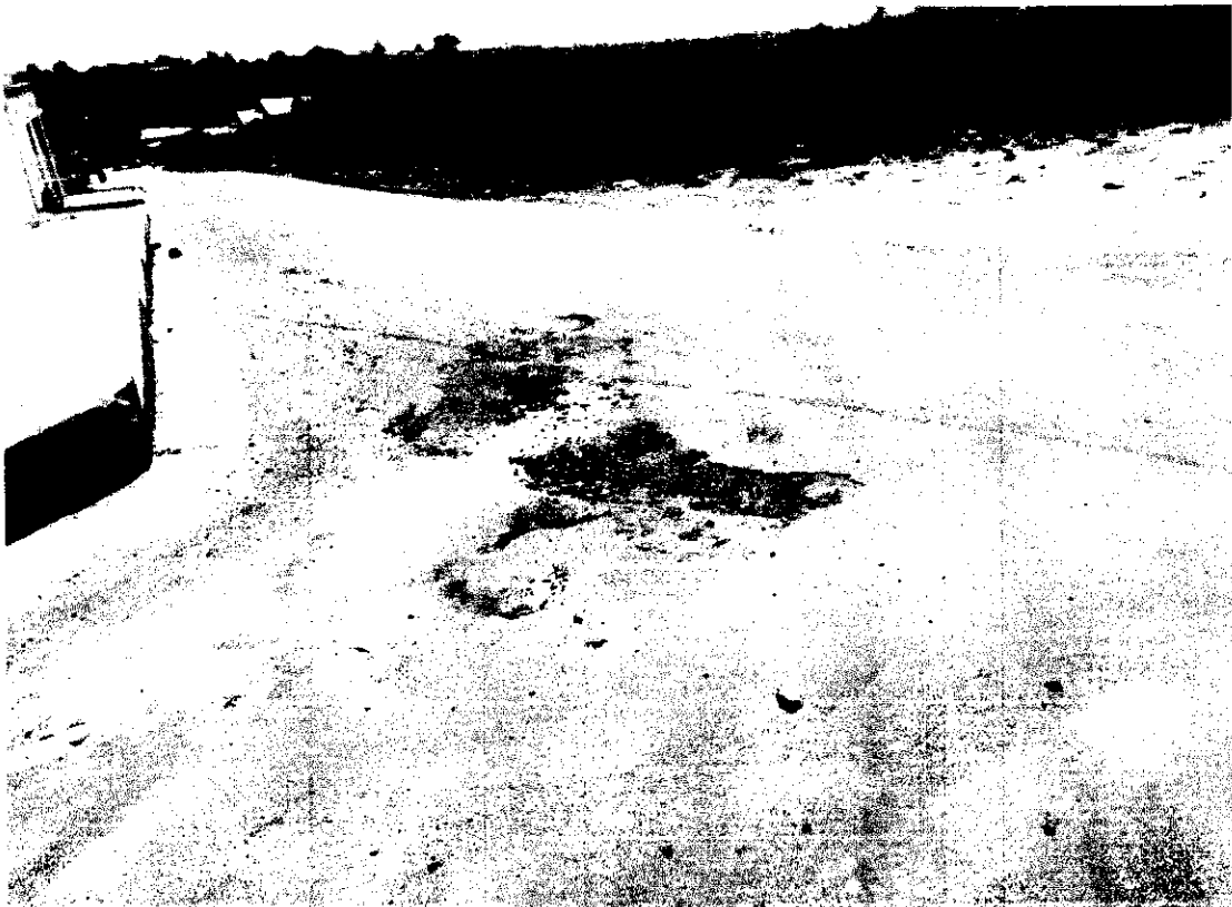
Figura 3 - Situação atual da rua Miguel Miranda.