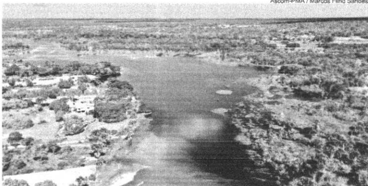
O objetivo das oficinas é a qualificação das empresas do Trade Turístico da cidade e região

"Ações de desenvolvimento do turismo regional têm sido muito importante para minha agência, os cursos de desen-