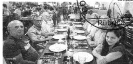
Integrantes do RCI Imperatriz realizam primeira reunião do ano