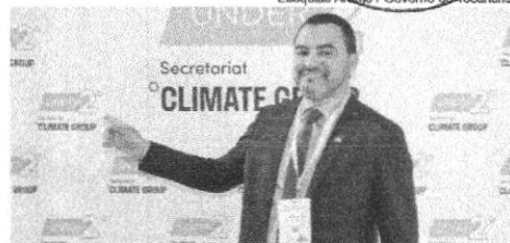
O Tocantins se junta a mais 200 Estados como signatário desse importante tratado para evitar que as temperaturas do planeta aumentem ainda mais

"Nos já temos visto os efeitos danosos da mudança do clima em várias regiões do Brasil. No Tocantins, nos últimos dias, tivemos tempestades que não são comuns, que deixaram estragos nas cidades. São situações que chamam a atenção do mundo para que todos se preocupem com a questão climática", destacou o governador, citando a recente assinatura do Pacto pelo Desmatamento Zero, firmado entre o Governo do Tocantins e o setor produtivo.