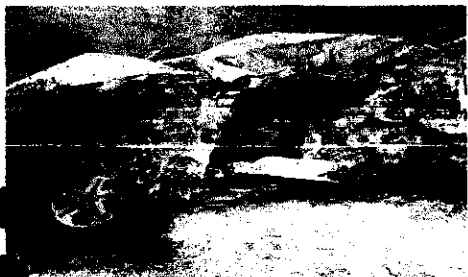
Carro em que se encontrava o casal teve perda total

Na tarde de terça-feira três acidentes graves aconteceram nas rodovias do Maranhão