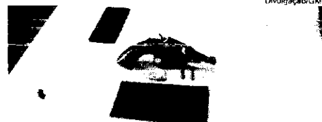
Revólver calibre 38, munições e maconha apreendidos com um dos adolescentes