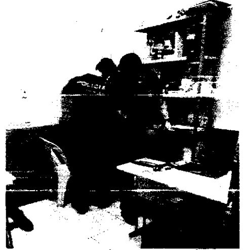
Agentes Federais quando da operação 'Fator Comum' em Belágua