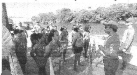
Crianças se divertiram durante o Projeto realizado na Praia do Rio do Sono

Pedro Afonso, a cerca de 220 km de Palmas, na Região Centro-Norte do Estado, recebeu a primeira edição do Projeto Botinho, do Corpo de Bombeiros Militar do Tocantins. A ação foi realizada no sábado (22/7) na Secretaria de Agricultura, e no domingo (23), na Praia do Rio Sono.