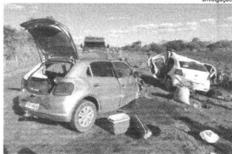
Os dois veículos bateram de frente

As vítimas são das cidades de Paraíso do Tocantins e Dois Irmãos