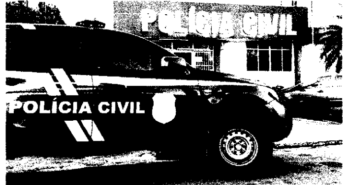
Polícia Civil prendeu o acusado

A vítima ainda relatou que ele ofereceu dinheiro para "ficar com ela"