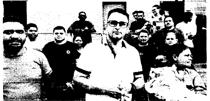
Várias pessoas foram para a Delegacia Regional de Polícia Civil denunciar