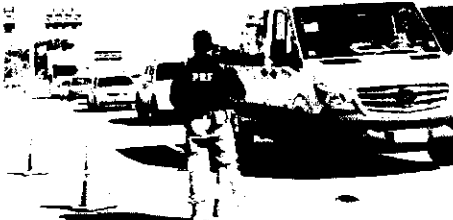
PRF aponta que 90 pessoas morreram em acidentes; no Maranhão foram 7 óbitos

As rodovias federais brasileiras registraram aumento nos números de acidentes, de feridos e de mortes durante o feriado de Natal de 2023, na comparação com o ano anterior.