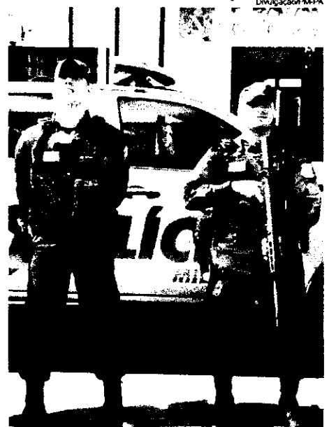
Policiais militares, um deles de Imperatriz, que morreram no acidente

A colisão foi violenta e os veículos ficaram totalmente destruídos, com perda total, tanto a viatura como o carro de passeio.