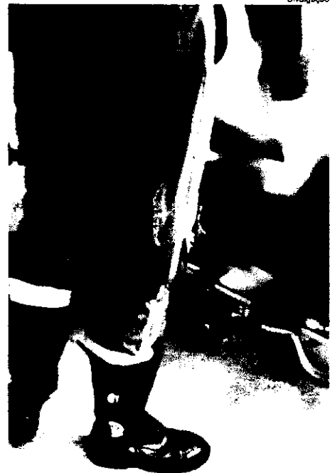
Socorristas do SAMU tiveram muito trabalho durante o feriado de Natal

A mulher foi detida e encaminhada para a 10ª Delegacia Regional de Imperatriz e a vítima atendida por uma