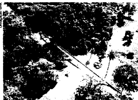
Nova rede possui diâmetro de 700 milímetros e extensão de 6.700 metros

mais uma etapa das várias frentes de trabalho que estão acontecendo simultaneamente, gerando um total de 350 empregos. A nova estação receberá o esgoto doméstico