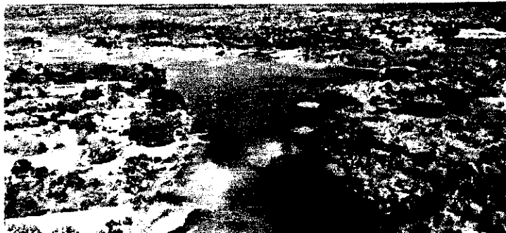
O objetivo das oficinas é a qualificação das empresas do Trade Turístico da cidade e região

"Ações de desenvolvimento do turismo regional têm sido muito importante para minha agência, os cursos de desen-