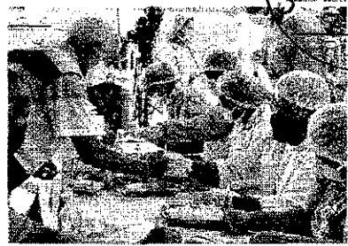
Ação Resgate aconteceu na área do Mercado Central com atendimentos

Para quem for flagrado dirigindo sob efeito de álcool em índice abaixo de 0,3 mg, a multa é de R$ 2.934,70 e o condutor perde o direito de dirigir suspenso por até 12 meses. A habilitação é recolhida e o motorista precisa passar novamente pela autarquia para voltar a dirigir. Quem se recusa a fazer o teste do etilômetro está sujeito às mesmas penalidades.