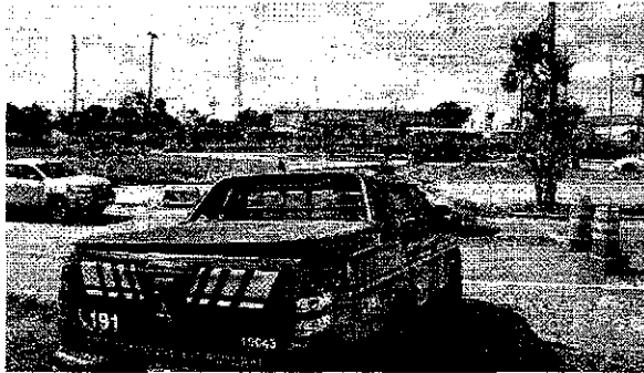
Polícia Rodoviária Federal tem registrado casos de embriaguez ao volante após flexibilização de normas

O outro flagrante foi registrado no Km 8 da BR-135, no Maranhão. Inspetor Noberto contou que houve um acidente de trânsito envolvendo dois veículos, um Agilê preto e um Corsa prata. Os policiais observaram que o condutor do Corsa apresentava sinais de embriaguez, e foi submetido ao teste de etilômetro. O exame constatou o teor de 1,10 miligramas de álcool por litro de ar expelido por seus pulmões.