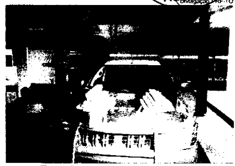
Flagrante aconteceu na tarde de ontem

A adolescente foi levada, juntamente com a mala, para a Delegacia de Polícia Civil da cidade. O Conselho Tutelar acompanhou o procedimento de entrega da menor ao delegado. (Assessoria)