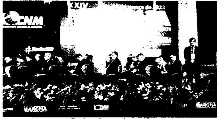
Evento será encerrado amanhã

“Pacto Federativo: um olhar para o futuro” é o lema