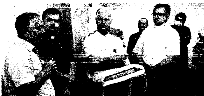
Evento de Inauguração do Hospital Dom Orione

Obra homenageia Dom Giuseppe Masiero, o quinto sucessor de São Luís Orione