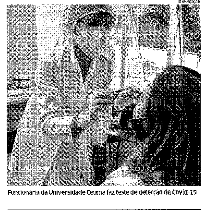
Funcionária da Universidade Ceuma faz teste de detecção da Covid-19

Em dois momentos do maior evento da Ceuma, o Grupo Ceuma reiterou o seu compromisso com a educação e com a saúde e garantir