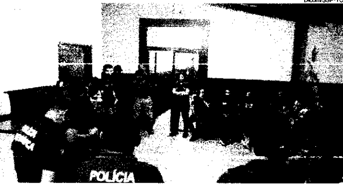
Dozenas de policiais participaram da operação

A Polícia Civil deflagrou a operação "Laboratório", nesta segunda-feira (13/03), visando investigar a prática de lavagem de dinheiro do tráfico de drogas por meio de estabelecimentos comerciais na cidade de Paraíso do Tocantins.