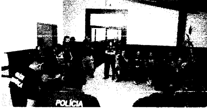
Dezenas de policiais participaram da operação

A Polícia Civil deflagrou a operação "Laboratório", nesta segunda-feira (13/03), visando investigar a prática de lavagem de dinheiro do tráfico de drogas por meio de estabelecimentos comerciais na cidade de Paraisópolis do Tocantins.