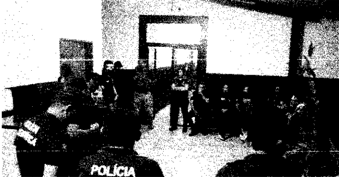
Dozenas de policiais participaram da operação

A Polícia Civil deflagrou a operação "Laboratório", nesta segunda-feira (13/03), visando investigar a prática de lavagem de dinheiro do tráfico de drogas por meio de estabelecimentos comerciais na cidade de Paraíso do Tocantins.