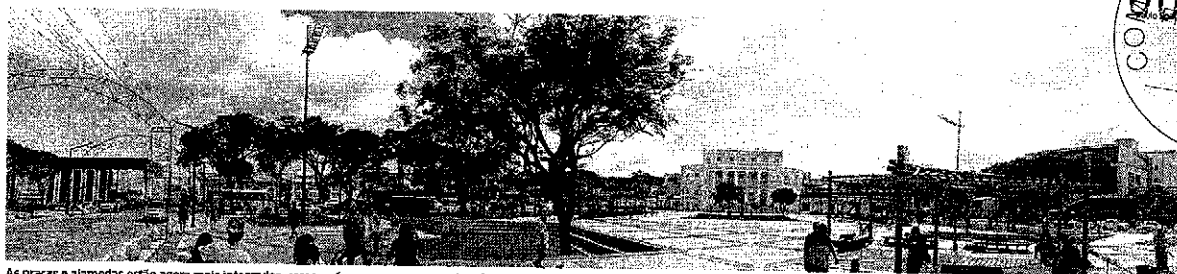
As praças e alamedas estão agora mais integradas, como se formassem uma grande e única praça, com espaços acessíveis e sem obstáculos, que é um verdadeiro convite ao pedestre, que pode passear no espaço