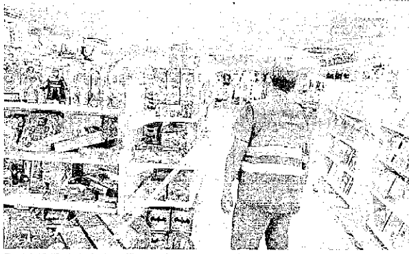
Fiscal da Vigilância Sanitária verifica com loja do capital cumprimento de medidas sanitárias estabelecidas

A Prefeitura de São Luís fiscalizou, do dia 5 de março até este último sábado e até o fim de semana (dias 26, 27 e 28), 482 estabelecimentos em diferentes bairros da capital, com o objetivo de fazer cumprir as regras de combate à Covid-19, punidas em decreto estadual e municipal que determinam as regras para o funcionamento de estabelecimentos comerciais. No total, foram 29 autuações e três interdições.