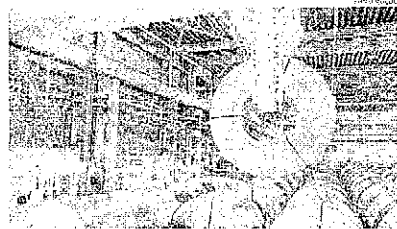
Falta de aço afeta a produção na construção civil, elevando preços

Dois dos órgãos mantêm a rotina de fiscalizações ao longo da semana, atendendo ao cumprimento das regras dos decretos estadual e municipal. Em caso de resistência do proprietário do estabelecimento, ele pode ser autuado e sofrer a suspensão de funcionamento administrativo sanitário, que resulta em multa por violação de interdito do estabelecimento.