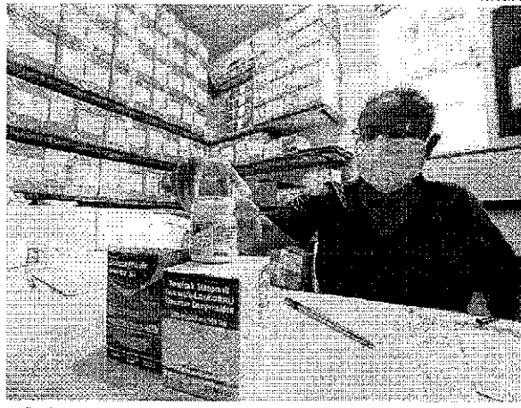
Medicações distribuídas na rede pública de saúde para pacientes que vivem com o HIV em São Luís

No cenário nacional, ainda de acordo com o Ministério da Saúde, desde 1990, foram diagnosticadas 1.011.617 casos de AIDS no Brasil. No entanto, de acordo com autoridades, o número de casos de AIDS vem caindo desde 2013, de acordo com o último Boletim Epidemiológico de Dezembro de 2020. Em 2019 foram diagnosticados 37.308