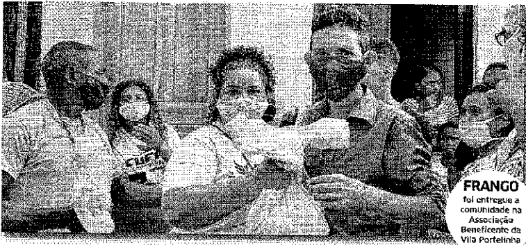
FRANGO foi entregue a comunidade na Associação Beneficente da Vila Portelinha