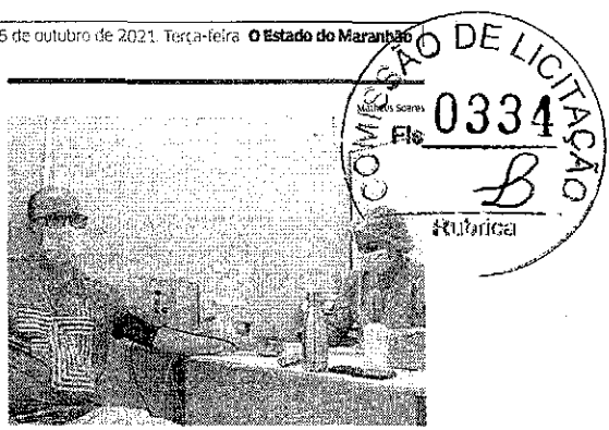
Hipertensos têm maior propensão a terem sequelas da covid

Marechal Casteln Branon irá a Ponte do São Francisco e ao longo da Avenida Daniel de La Touche. No total, serão 29 cruzamentos controlados pelo programa. Segundo os estudos realizados pela SMTT para a implantação do sistema, o ganho de tempo no trecho entre o Elevado da Cohanha e a