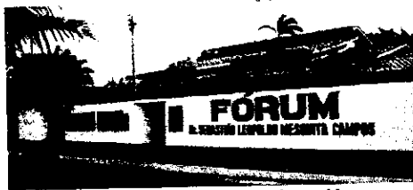
Julgamento de crimes contra a vida pelo Tribunal de Juri Popular