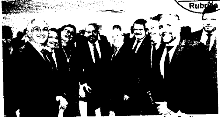
Reunião ordinária do Conselho Nacional dos Procuradores-Gerais do Ministério Público dos Estados e da União (CNPGE)