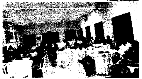
Solenidade movimentada a sede do Rotary Club, com expressivo número de convidados