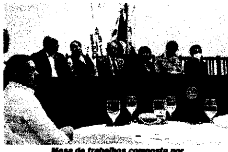
Massa de trabalhos composta por rotarianos e autoridades