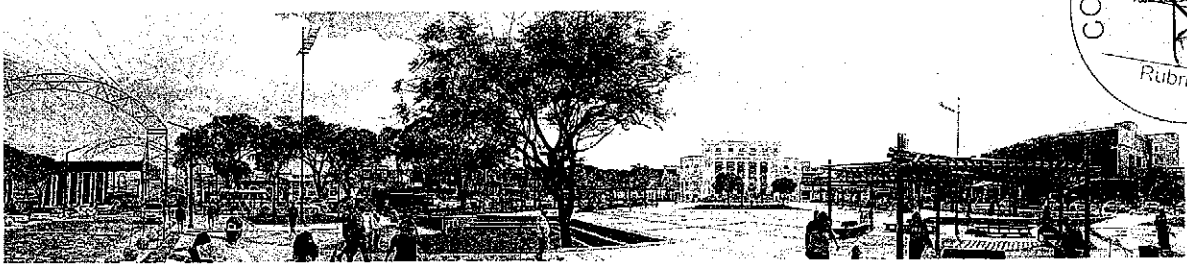
As praças e alamedas estão agora mais integradas, como se formassem uma grande e única praça, com espaços acessíveis e sem obstáculos, que é um verdadeiro convite ao pedestre, que pode passear no espaço