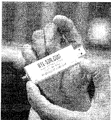
Dispositivo que funciona como rádio e auxilia na captação de sinais de satélite