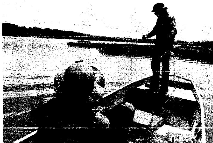
Fiscais retiram redes de pesca durante ação da lago da UHE Estreito

Diante dos fatos, a ordem judicial foi cumprida por policiais civis da 8ª Divisão de Combate ao Crime Organiza-