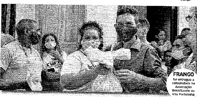
FRANGO foi entregue à comunidade na Associação Beneficente da Vila Portelinha