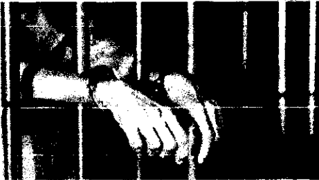
Homem está recolhido na Unidade Penal Regional de Gurupi

A Polícia Civil cumpriu, na manhã desta segunda-feira (15), mandado de prisão preventiva contra um homem de 34 anos que era foragido do Estado de Goiás pelo crime de homicídio.