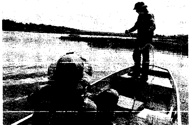
Fiscais retiram redes de pesca durante ação de lago da UHE Estreito

A autoridade policial também agradeceu o empenho de toda a equipe do 7º Núcleo Regional de Papiloscopia de Gurupi, pois o apoio foi de fundamental importância para que fosse possível realizar a correta identificação do homem. O delegado também ressaltou a colaboração do Setor de Inteligência da Polícia Militar de Goiás, o que possibilitou a localização do mandado judicial em aberto contra o homem por homicídio. (Assessoria)