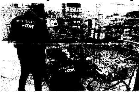
Os fiscais já apreenderam montes em uma caixa de 17.000 produtos vencidos em todo o Estado