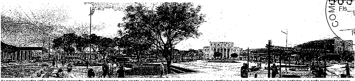
As praças e alamedas estão agora mais integradas, como se formassem uma grande e única praça, com espaços acessíveis e sem obstáculos, que é um verdadeiro convite ao pedestre, que pode passear no espaço